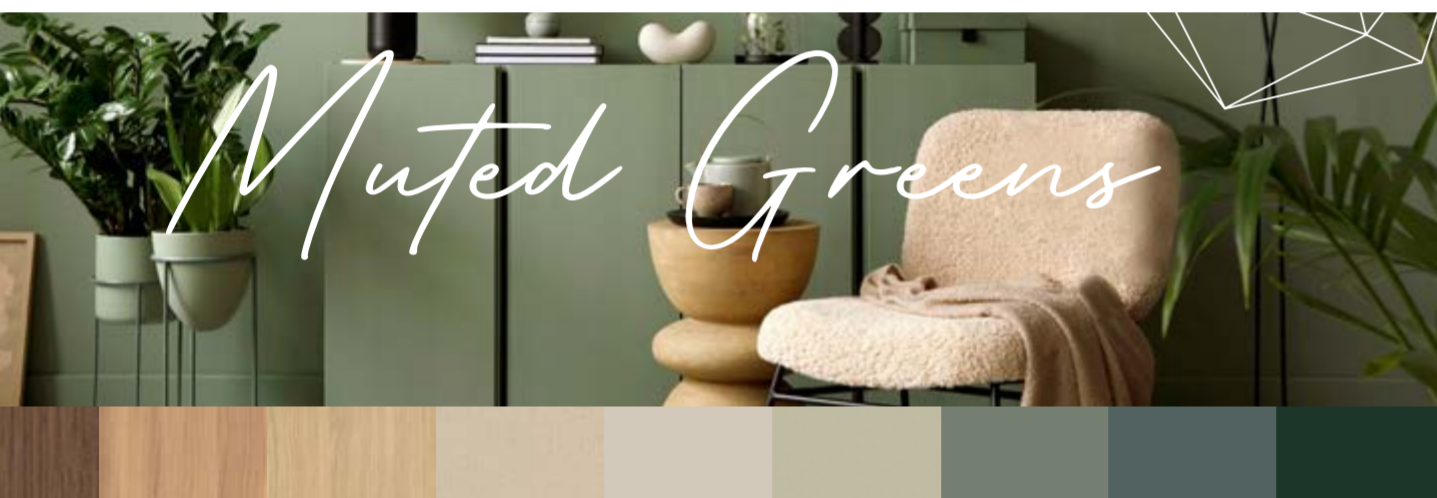
„Muted Greens“ ist eine der sechs „Capsules“, die EGGER zum Start präsentiert hat. „Muted Greens“ è una delle sei “Capsule” presentate da EGGER al lancio.

So wird beispielsweise die Oberfläche ST2 Smoothtouch Pearl durch ST7 Smoothtouch Fine Pearl ersetzt, die mit einem reduzierten Glanzgrad überzeugt. Auch das Dekor W911 Cremeweiß wird von W990 Kristallweiß abgelöst, wobei die neuen Weißtöne neutraler sind und durch glattere, mattere Oberflächen bestechen.