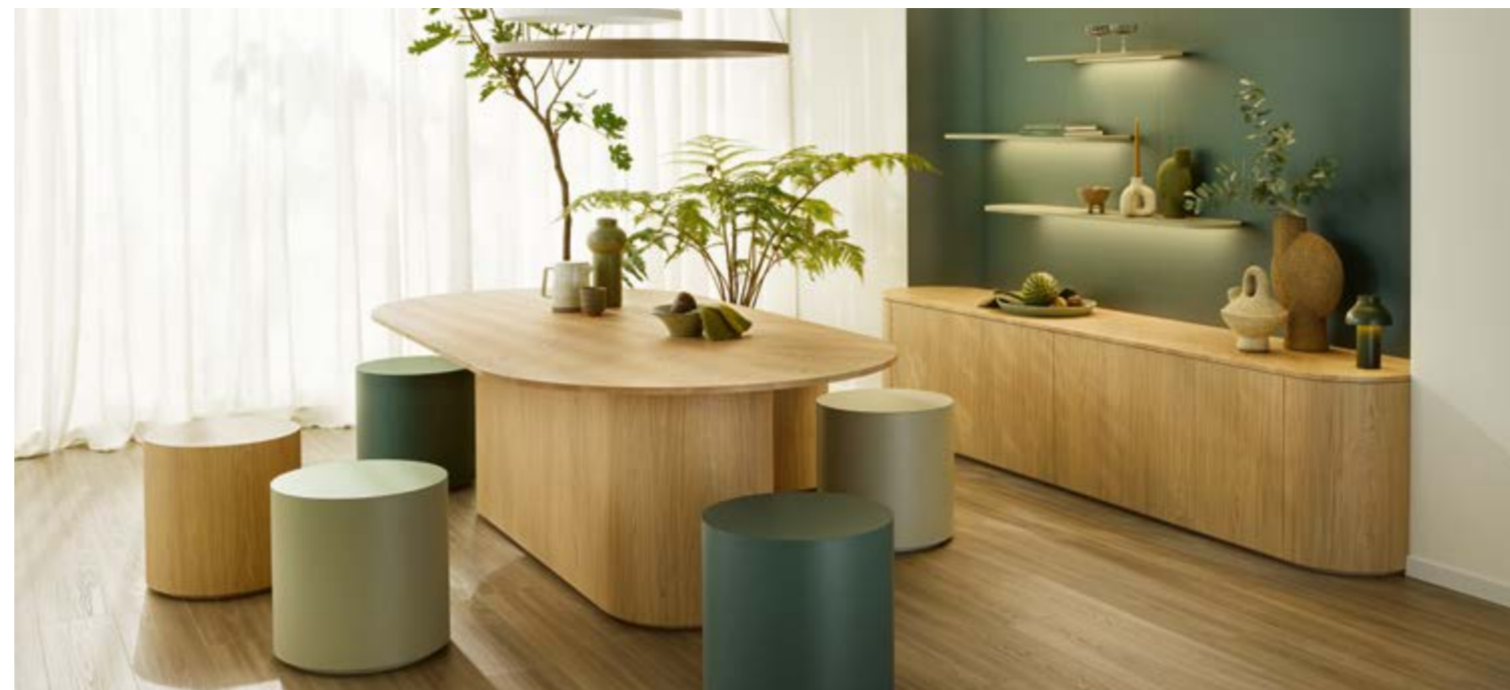
Neu entwickelte Synchronporen-Oberfläche ST40 Feelwood Oakgrain. Nuova superficie ST40 Feelwood Oakgrain con un poro sincronizzato.

Tra le novità, la superficie ST2 Smoothtouch Pearl è stata sostituita dalla ST7 Smoothtouch Fine Pearl, caratterizzata da un grado di lucentezza più ridotto. Inoltre, il decoro W911 Bianco crema è stato sostituito con il W990 Bianco cristallo, offrendo tonalità di bianco più neutre e superfici più lisce e opache.