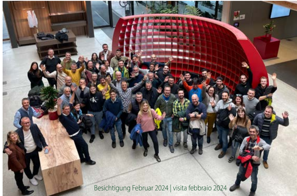
Besichtigung Februar 2024 | visita febbraio 2024

Wir blicken zurück auf zwei spannende und interessante Besichtigungen bei unserem Partner EGGER. Im Januar und im Februar besuchten einige unserer geschätzten Kunden und Kundinnen gemeinsam mit unserem Verkaufsteam das EGGER Stammhaus in St. Tirol, wo uns die neue EGGER Kollektion Dekorativ 24+ exklusiv vorgestellt wurde.