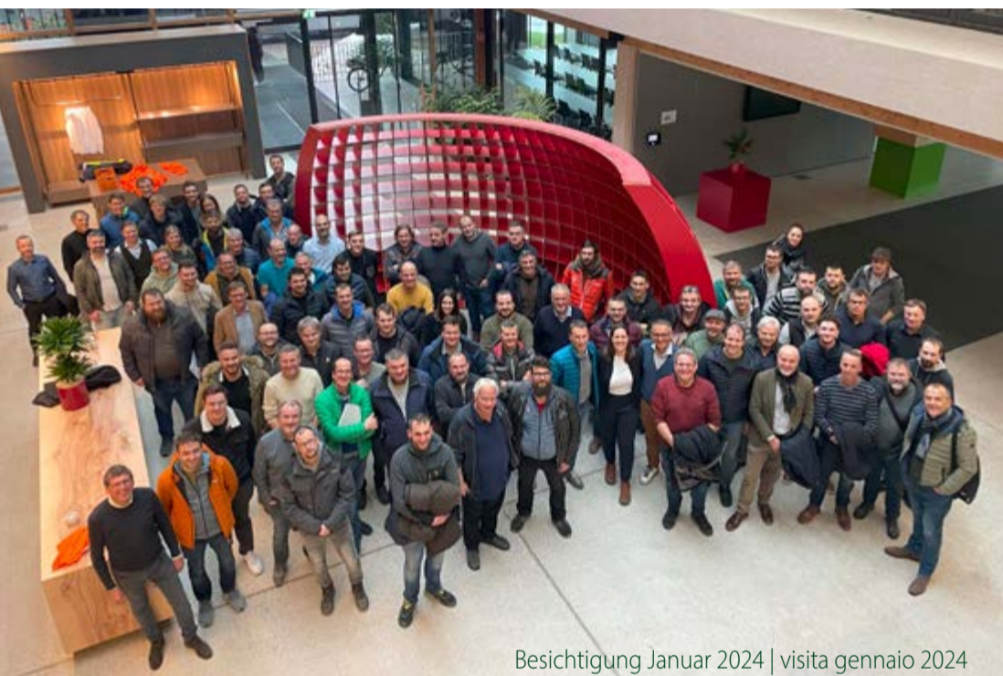
Besichtigung Januar 2024 | visita gennaio 2024