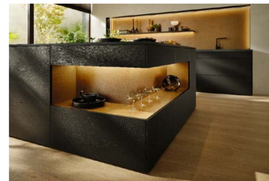
Neue PerfectSense Feelwood Lackplatte U999 TM28 Schwarz. Nuovo pannello verniciato PerfectSense Feelwood U999 TM28 Nero.